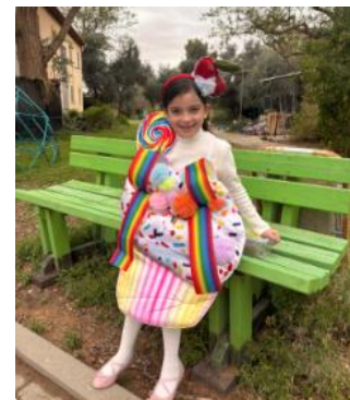
גלי הקאפקייק מחכה לחלק לכם סוכריות...ליד הבית שלה, שגיב 36 בואו!