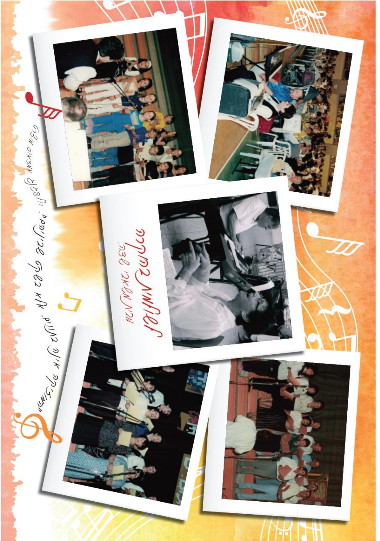
אזכרה לזכר אבא אריאל מילר וזכר אבא אריאל מילר