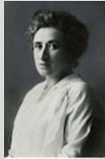
נולדה: 5 במרץ 1871 נרצחה: 15 בינואר 1919

ביום בהיר, במאי 1919, נראה שיער אדמוני מבצבץ בנחל, בלב פארק טירגארטן בברלין. ארבעה חודשים אחרי שנעלמה, נמצאה גופתה. עד היום ניצבת שם אנדרטה לזכרה.